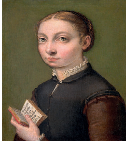
Autoritratto, 1554, olio su tela, Vienna, Kunsthistorisches Museum

La luminosità e i colori dei suoi dipinti hanno un tale fascino da appannare La canestra di frutta del Caravaggio Fede Galizia al confronto con Sofonisba risulta diversa, umbratile, non bella; anche lei figlia d'arte comincia a dipingere quando Sofonisba è già un mito a Genova ed è spinta a questa arte dal prestigio sociale che può derivare a chi si dedica alla pittura. A diciotto