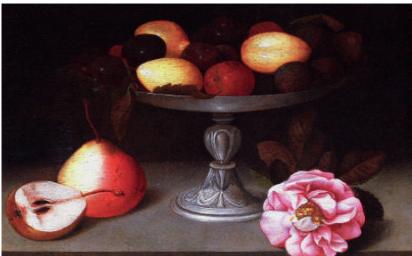
Natura morta Collezione privata