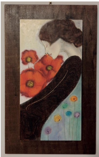
Maria Teresa Moffa: "Rinascita" Pastelli ad olio e pirografia su pannello di legno Cm 20 x 42

Essere umani. E' questo il miracolo quotidiano: il permesso di non dover splendere per forza per scoprire che la nostra bellezza più vera nasce dalla grazia con cui permettiamo alla vita di scorrere attraverso di noi, così come siamo.