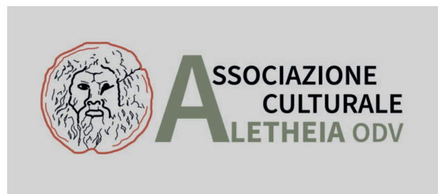
Nuovo Logo "Associazione Culturale Aletheia"